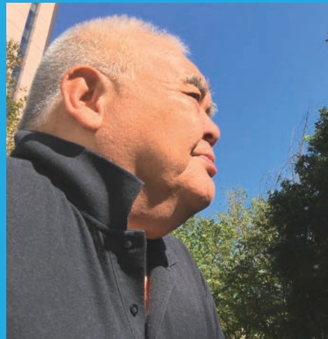
秘密戦隊ゴレンジャー 2代目キレンジャー/熊野大五郎 だるま二郎さん